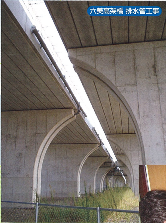
六美高架橋 排水管工事